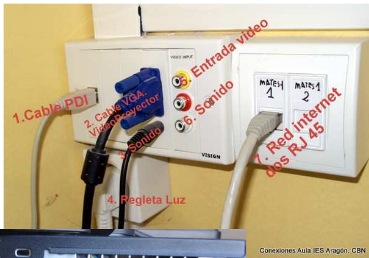
Conexiones Aula IES Aragón. CBN

Si no se soluciona el problema: Rellenar parte incidencias