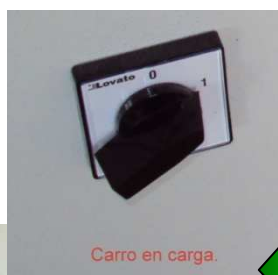
Carro en carga.